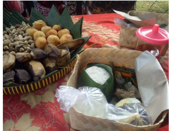
Gambar 6. Sesaji Nasi Gudangan dan Jajan Pasar

Berupa hasil pertanian (Kangkung, bayam, tauge, kacang Panjang) yang diolah secara tawar dan diberi tambahan bumbu manis pada parutan kelapa muda merupakan simbol ungkapan syukur kepada Tuhan Yang Maha Esa karena telah memberikan berkah dari hasil pertanian.