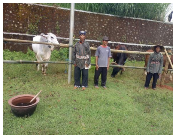
Gambar 5. Memandikan Hewan Ternak