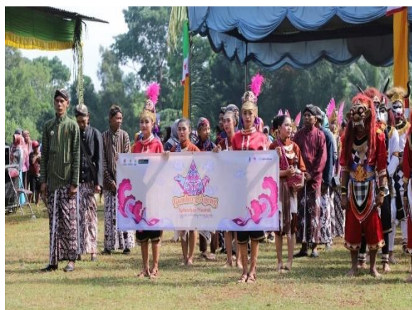
Gambar 2. Upacara Tradisi Gumbreg Ageng

Generasi penerus perlu meneladani dan menginternalisasikan terhadap salah satu bentuk ungkapan budaya pada Upacara Tradisi Gumbreg Ageng dikarenakan memuat nilai-nilai kearifan budaya lokal masyarakatnya serta memiliki arti dan makna tersendiri.