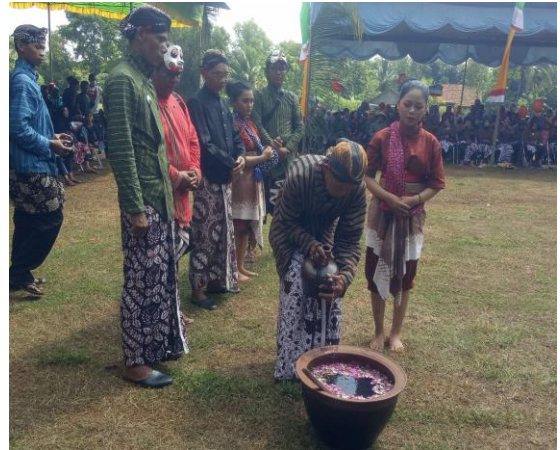
Gambar 4. Penyatuan 3 Sumber Mata Air