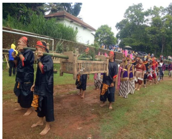
Gambar 3. Aktivitas Tradisi Gumbreg Ageng

Pada upacara tradisi Gumbreg Ageng di Kelurahan Budaya Muntuk, Dlingo, Bantul, Yogyakarta ditemukan beberapa hal berupa nilai-nilai budaya luhur yang dapat dipetik untuk diteladani, antara lain berkaitan dengan: