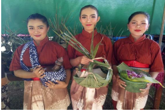
Gambar 7. Kelengkapan Sesaji

Secara obyektif, deskripsi tentang sistem budaya tradisi di masyarakat Muntuk merupakan kontribusi positif dalam memperkuat jati diri dan kepribadian masyarakat guna tercapainya integritas bangsa dan industri kepariwisataan di Yogyakarta.