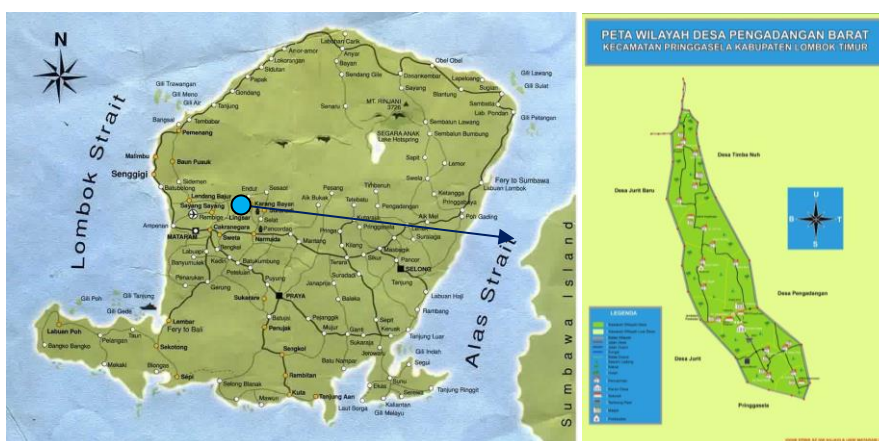
Gambar 1: Lokasi Desa Pengadangan Barat

Penelitian mengadopsi pendekatan kualitatif dengan metode studi kasus. Pemilihan studi kasus sebagai rancangan penelitian ini karena memungkinkan peneliti untuk mendapatkan pemahaman yang detail dan mendalam tentang subjek penelitian (Yin, 1994). Penelitian dilakukan di Desa Pengadangan Barat yang berlokasi di Kabupaten Lombok Timur, Nusa Tenggara Barat. Partisipan penelitian adalah stakeholders Desa Wisata Pengadangan Barat yakni pemerintah Desa, anggota Pokdarwis, tokoh budaya, agama dan pemuda serta masyarakat yang dianggap peduli dan yang memiliki pandangan kontradiktif terhadap Desa Wisata. Penentuan sampel dilakukan secara purposive dan snowball dimana para partisipan merupakan individu yang