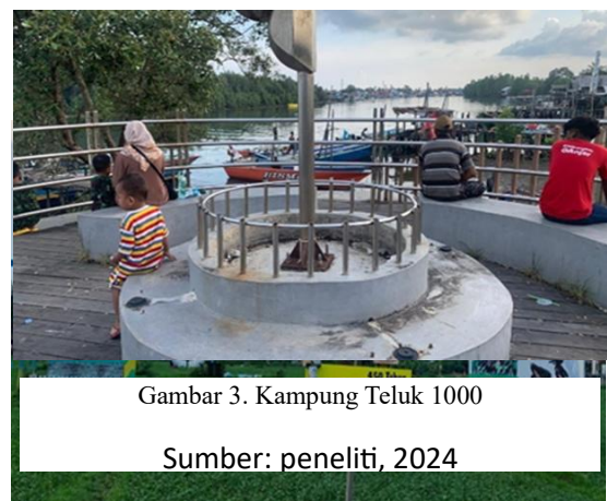
Gambar 3. Kampung Teluk 1000

Kampung Teluk Seribu merupakan objek wisata buatan yang ada di Kota Balikpapan. Lokasi dari wisata ini berada di Jl.Persatuan, Manggar Baru, Kec. Balikpapan Timur.