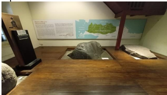
Gambar 2. Salah Satu Koleksi Prasasti

Berdasarkan hasil observasi, didapatkan bahwa Museum Sejarah Indonesia memiliki koleksi sejarah yang kaya, sehingga hal ini dirasa sesuai dengan aspek intelektual dari wellness tourism .