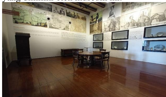
Gambar 3. Suasana Tenang Dalam Museum

Aspek lain yang penulis temukan selama melakukan observasi adalah secara tidak langsung, wisatawan juga dapat merasakan sensasi spiritual dan peningkatan kesehatan mental yang dapat dicapai dengan suasana tenang dan nyaman yang dimiliki oleh museum ini.