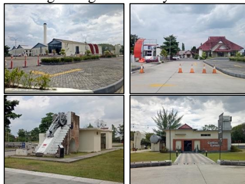
Foto: Kondisi Kompleks De Tjolomadoe Tahun 2021

bangunan, elemen-elemen pembentuk identitas tersebut juga masih tetap dilestarikan. Elemen-elemen tersebut antara lain adalah struktur dan komponen bangunan, mesin-mesin pabrik gula dan juga penamaan pada ruang-ruang di dalamnya.