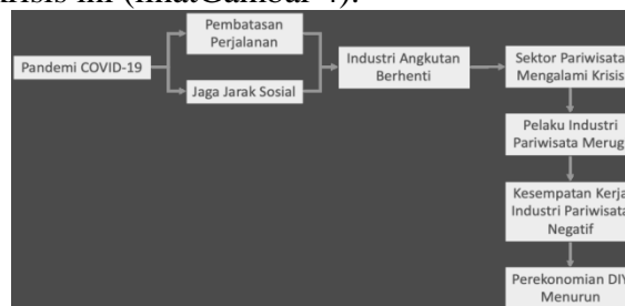
Gambar 3. Dampak Pandemi Covid-19

DIY mengalami ikrisis. Kunjungan ke destinasi wisata terhenti, tingkat hunian hotel, kunjungan kerestoran, transaksi perdagangan yang terkait dengan pariwisata turut mengalami krisis. Banyak pelaku usaha mengalami kerugian sehingga berdampak pada pengurangan tenaga kerja. Perekonomian DIY turut terkena dampak krisis ini (lihat Gambar 4).