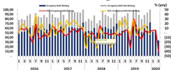
Grafik2: Tingkat Hunian Hotel Berbintang dan non-Bintang di DIY