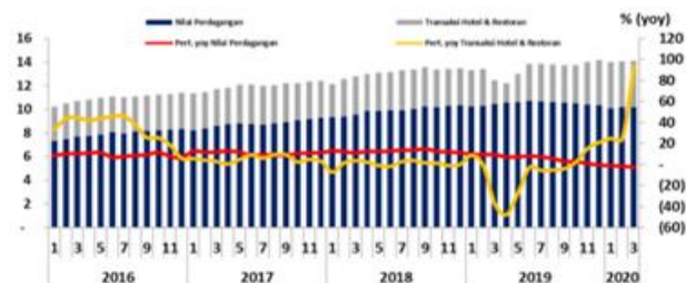
Grafik3: Transaksi Perdagangan dan Restoran di DIY