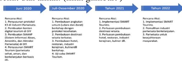
Gambar 4 : Peta Jalan Pemulihan Pariwisata di DIY

Pemulihan industri pariwisata di DIY akan dilakukan secara bertahap. Tahap pertama sudah dimulai sejak Juni lalu dengan melakukan serangkaian rencana aksi. Rencana aksi yang pertama adalah menyusun protokol K3 (Kesehatan, dan Keselamatan Kerja) untuk semua industri pariwisata di DIY. Setiap pelaku industri pariwisata di DIY harus memiliki unit K3 untuk menjamin pelaku dan pengunjung sehat dan aman. (lihat gambar 9)