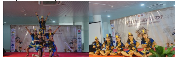
Gambar 4. Sanggar Tari Tradisional

Salah satu capaian utama kegiatan ini adalah tersedianya ruang ekspresi bagi pelaku seni dan komunitas budaya lokal. Melalui TELULIKUR Culture Fest, berbagai sanggar tari tradisional dan pelaku seni mendapatkan kesempatan untuk menampilkan karya mereka di hadapan publik yang lebih luas. Penampilan meliputi tari tradisional, tari kreasi, dan pertunjukan tunggal yang merepresentasikan kekayaan budaya daerah.