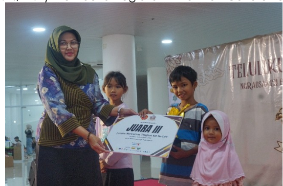
Gambar 13. Praktisi/Dosen Matakuliah MICE Kegiatan TELULIKUR Culture Fest

Partisipasi institusi memperkuat posisi kegiatan sebagai bagian dari implementasi Tri Dharma Perguruan Tinggi, khususnya pada aspek pengabdian kepada masyarakat.