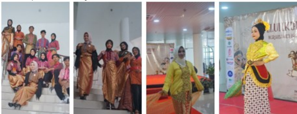
Gambar 8. Generasi Muda Sangat Antusias Berlomba Pada TELULIKUR Culture Fest

Kegiatan TELULIKUR Culture Fest berhasil menerapkan model edukasi budaya berbasis event, di mana proses pembelajaran budaya dilakukan melalui pengalaman langsung, pengamatan, dan partisipasi aktif. Model ini terbukti lebih menarik bagi generasi muda dibandingkan pendekatan ceramah atau pembelajaran teoritis semata.