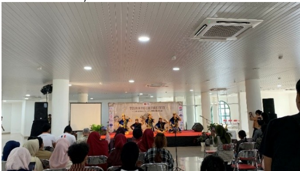
Gambar 2. Hari ke-1` TELULIKUR Culture Fest

berbasis event, tetapi juga sebagai aktivitas pengabdian yang memberikan dampak langsung kepada masyarakat dan pelaku seni budaya. Pelaksanaan kegiatan berlangsung selama dua hari, yaitu pada tanggal 24–25 Januari 2026, bertempat di kawasan Taman Budaya Embung Giwangan. Lokasi ini dipilih karena memiliki fungsi sebagai ruang publik budaya yang terbuka, mudah diakses masyarakat, dan mendukung penyelenggaraan kegiatan pertunjukan serta pameran budaya. Kegiatan dirancang dalam format festival budaya terpadu yang memadukan unsur pertunjukan seni, pameran produk kreatif, kompetisi mahasiswa, serta sesi edukasi budaya melalui talkshow.