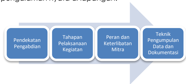
Gambar 1. Alur Pendekatan metode pengabdian

Pendekatan metode pengabdian ini selaras dengan prinsip pengabdian kepada masyarakat yang menekankan pada keterlibatan langsung mitra, proses pembelajaran bersama ( learning by doing ), serta penguatan kapasitas komunitas melalui pengalaman nyata di lapangan.