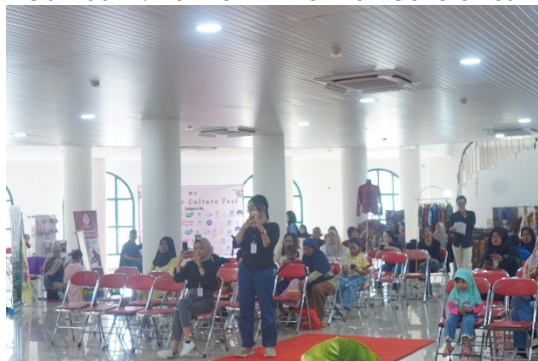
Gambar 3. Hari ke-2` TELULIKUR Culture Fest

Secara umum, kegiatan berjalan sesuai dengan rencana yang telah disusun pada tahap persiapan. Seluruh unsur utama kegiatan dapat terlaksana, mulai dari pembukaan, rangkaian pertunjukan seni, expo budaya dan produk kreatif, hingga sesi diskusi dan interaksi dengan pengunjung. Dosen berperan sebagai pembimbing lapangan dan penanggung jawab mutu kegiatan, sementara mahasiswa menjalankan fungsi operasional sebagai panitia pelaksana.