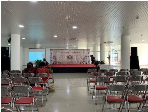
Gambar 11. Tempat yang disediakan Taman Budaya Embung Giwangan

Pengelola Taman Budaya Embung Giwangan memberikan dukungan dalam bentuk penyediaan ruang, fasilitas dasar, serta koordinasi teknis lokasi. Dukungan ini sangat menentukan kelancaran kegiatan, khususnya dalam pengaturan area pertunjukan dan pameran.