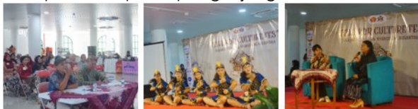
Gambar 10. Para Mitra terlibat langsung

Mitra komunitas budaya berperan aktif dalam seluruh rangkaian kegiatan. Keterlibatan mereka tidak terbatas sebagai pengisi acara, tetapi juga sebagai pihak yang memberikan masukan terhadap konsep pertunjukan, susunan acara, serta bentuk penyajian budaya kepada publik. Komunitas seni berkontribusi dalam menyiapkan materi pertunjukan, properti budaya, serta narasi budaya yang disampaikan kepada pengunjung.