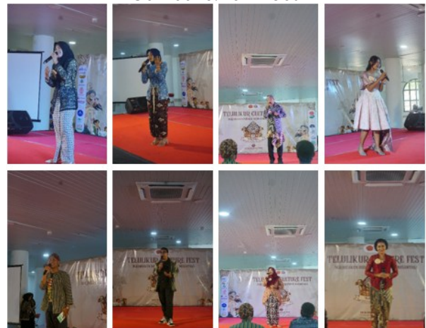
Gambar 6. Pertunjukan Tunggal Lomba Nembang Jawa SMA/SMK "Gumebyar Swara, Gumelar Budaya"

Ruang ekspresi ini menjadi penting karena tidak semua komunitas seni memiliki akses rutin terhadap panggung pertunjukan publik. Dengan adanya festival budaya ini, pelaku seni memperoleh kesempatan untuk menunjukkan eksistensi, meningkatkan kepercayaan diri, serta membangun jejaring dengan komunitas lain. Dampak tidak langsungnya adalah meningkatnya motivasi komunitas untuk terus melatih dan mengembangkan karya budaya.