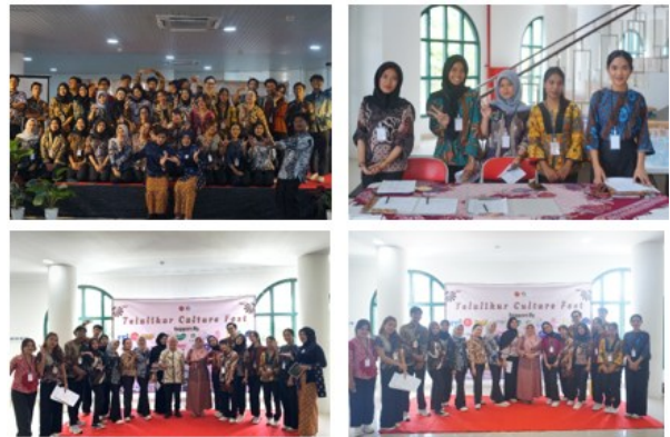
Gambar 9. Mahasiswa STIEPAR-API yang terlibat di TELULIKUR Culture Fest

koordinasi, operasional, hingga evaluasi kegiatan. Mereka belajar mengelola jadwal pertunjukan, koordinasi dengan pengisi acara, pengaturan alur pengunjung, serta penanganan kebutuhan teknis di lapangan.