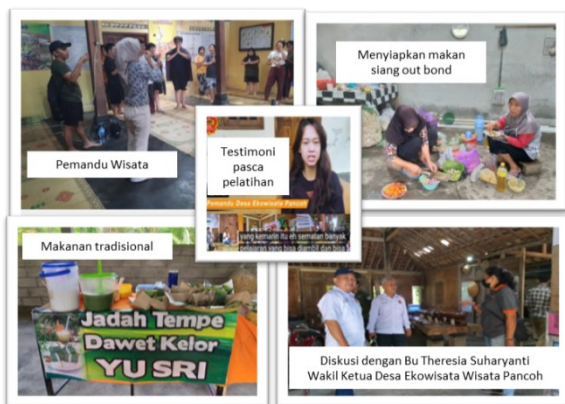
Gambar 4: Perempuan sebagai pelaku utama

Gambar 4, mencerminkan peran perempuan sebagai pelaku utama di desa ekowisata Pancoh.