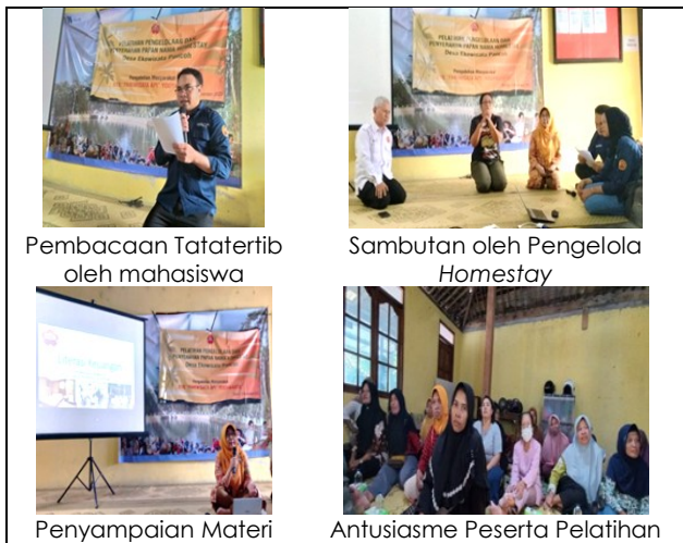
Gambar 2: Pelaksanaan Pelatihan

1. Ragam Program Pelatihan dan Pendampingan Program pelatihan dilakukan dengan materi yang disesuaikan dengan hasil need assessment yang dilakukan pada awal pendampingan Tahun 2023. Dalam berbagai pelatihan yang diadakan, proporsi perempuan rata-rata sekitar 30% dari total peserta. Namun untuk pelatihan homestay , literasi keuangan dan kemasan produk semua peserta adalah perempuan. Berbagai pelatihan yang telah dilaksanakan pada tahun 2023 adalah: penyusunan paket wisata, pemandu wisata, pengelolaan homestay I, pengelolaan Home stay II, kemasan produk UMKM dan literasi keuangan. Gambaran pelatihan homestay disajikan dalam gambar 2.