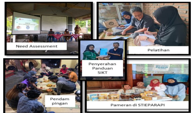
Gambar 5: Dinamika Pendampingan Perempuan

Melalui pendekatan tersebut, kegiatan pendampingan tidak berhenti pada capaian output pelatihan, tetapi berorientasi pada outcome dan dampak jangka panjang. Hal ini mendukung pencapaian SDGs, khususnya SDGs 5, 8, 11, dan 12, melalui peningkatan akses ekonomi, partisipasi perempuan dalam pengambilan keputusan, pelestarian budaya lokal, serta praktik usaha pariwisata yang bertanggung jawab. Gambar 5 menunjukkan dinamika pendampingan perempuan di desa ekowisata Pancoh.