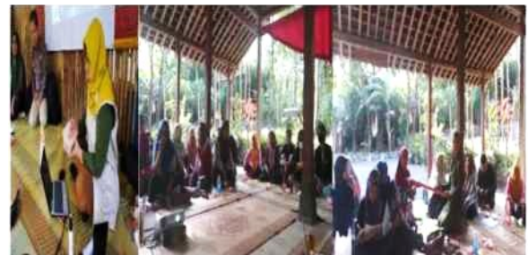
Gambar 3: Suasana dan Proses Pelatihan

secara umum ( Homestay I) dan kedua dengan materi hygiene dan sanitasi Homestay ( Homestay II). Untuk mendukung pengelolaan usaha ( homestay dan UMKM) diadakan pelatihan lanjutan yaitu literasi keuangan dengan tujuan peningkatan kapasitas perempuan (pemilik homestay maupun UMKM) agar dapat mengelola keuangan usaha dengan benar serta mampu menentukan sumber dan penggunaan dana berdasarkan perencanaan keuangan atau arus kas yang dibuat. Selanjutnya, pelatihan kemasan, terdiri dari dua materi yakni kemasan produk non pangan dan kemasan produk pangan. Pelatihan kemasan produk pangan dilaksanakan secara terpisah karena aspek kemasan pangan harus memenuhi aturan/kaidah Badan Pengawas Obat dan Makanan (BPOM) guna memastikan keamanan pangan bagi konsumen sekaligus memberikan informasi yang terkait dengan makanan yang ada dalam kemasan. Dinamika pelatihan Kemasan Produk disajikan dalam gambar 3 berikut ini.