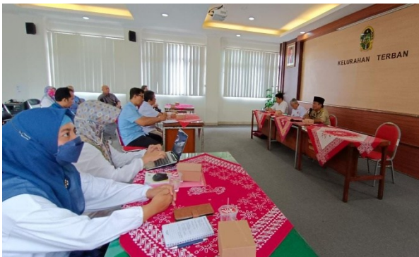
Gambar 7. Feedback dari pengelola kampung wisata