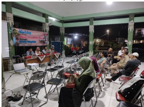
Gambar 5. Pengerjaan Pre Test Peserta