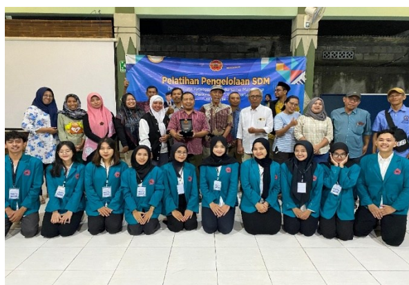
Gambar 3. Peserta Pelatihan dan Narasumber

Beberapa faktor yang mendukung terlaksananya kegiatan pengabdian kepada masyarakat ini adalah Materi pelatihan kontekstual sesuai kebutuhan lokal, Pendekatan partisipatif membuat masyarakat aktif terlibat, Adanya simulasi langsung dan pemetaan potensi secara praktis. Sedangkan faktor penghambatnya adalah Waktu pelatihan yang terbatas membuat pendampingan lanjutan belum optimal, Akses internet beberapa peserta masih terbatas untuk mendalami materi digital marketing.