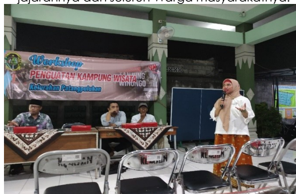
Gambar 2. Survey dan sharing dengan Kepala desa Pelaksanaan Kegiatan Pengabdian

Pra Pelaksanaan dilakukan dengan Observasi awal dan wawancara dengan tokoh masyarakat Patangpuluhan. Setelah itu melakukan Identifikasi kebutuhan pelatihan melalui form isian dan diskusi awal. Kemudian melakukan Penyusunan modul pelatihan dan materi berbasis potensi lokal.