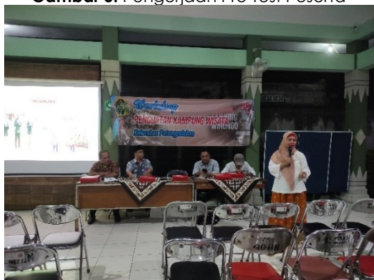
Gambar 6. Menjawab QnA