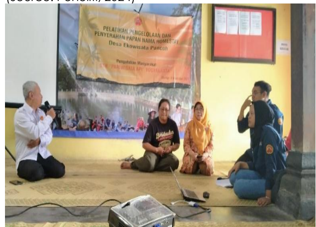
Gambar 6. Pemaparan persiapan praktek kebersihan