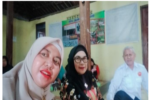
Gambar 2. Diskusi antara para pelaksana PKM di Desa Ekowisata Pancoh