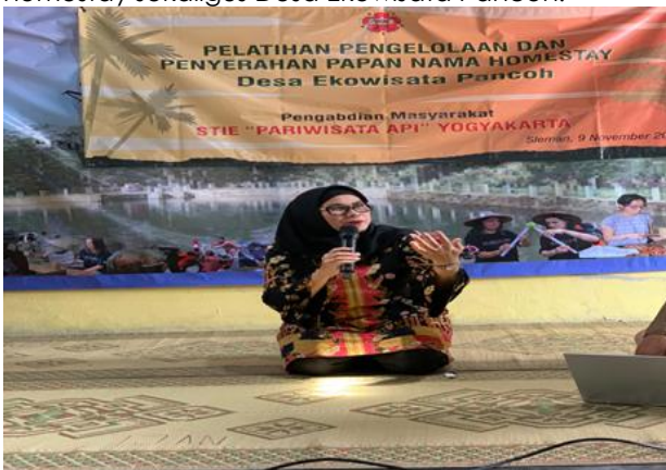
Gambar 4. Pemaparan Narasumber pertama

Beberapa faktor yang mendukung terlaksananya kegiatan pengabdian kepada masyarakat ini adalah dukungan dari Pengurus pokdarwis Desa Ekowisata Panchoh dan koordinator homestay yang selalu memperhatikan pemilik homestay untuk terus berinovasi dan berkreasi demi semakin majunya homestay sekaligus Desa Ekowisata Panchoh.