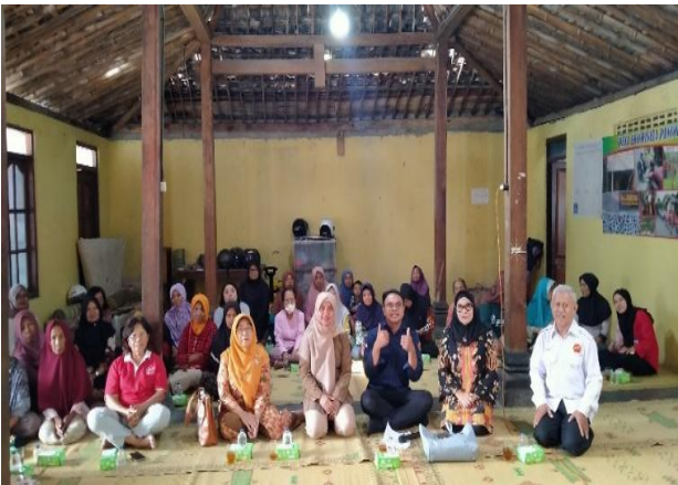
Gambar 7. Foto Bersama Peserta pelatihan