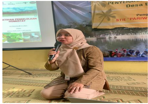
Gambar 5. Pemaparan Narasumber kedua

Beberapa faktor yang mendukung terlaksananya kegiatan pengabdian kepada masyarakat ini adalah dukungan dari Pengurus pokdarwis Desa Ekowisata Panchoh dan koordinator homestay yang selalu memperhatikan pemilik homestay untuk terus berinovasi dan berkreasi demi semakin majunya homestay sekaligus Desa Ekowisata Panchoh.