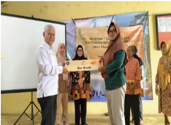
Gambar 3. Penyerahan Plakat nama Homestay