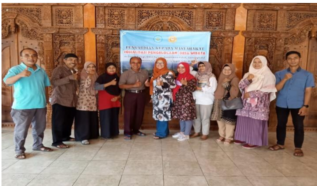
Gambar 7. Bersama calon Pengurus pokdarwis