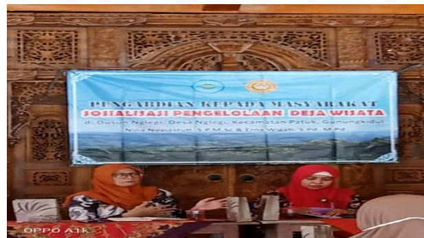
Gambar 6. Memandu QnA