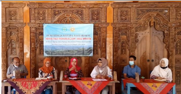
Gambar 3. Penyampaian Materi Desa wisata

Beberapa faktor yang mendukung terlaksananya kegiatan pengabdian kepada masyarakat ini adalah semangat yang sangat kuat dari kepala desa dan warganya yang betul betul sangat antusias ingin menjadikan desa ngelegi menjadi desa wisata. Banyaknya pertanyaan dari warga yang ingin segera memulai untuk segera terbentuk kelembagaan yang nanti akan di harapkan dapat mengelola desa wisata. Sedangkan faktor penghambatnya adalah keterbatasan waktu dalam melakukan survey dan pemetaan potensi karena beberapa warga yang memiliki pengetahuan tentang potensi budaya tidak bisa ditemui secara bersamaan karena pekerjaan utama mereka yang tidak bisa di tunda.