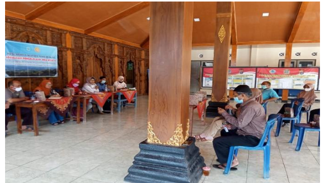
Gambar 5. QnA peserta dengan narasumber