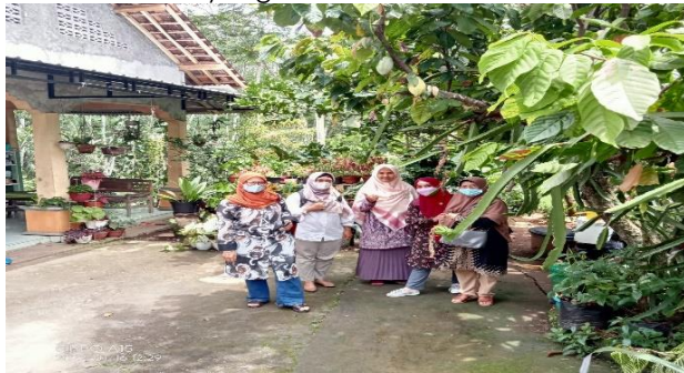
Gambar 4. Mapping Potensi taman baca sebagai atraksi wisata

Beberapa faktor yang mendukung terlaksananya kegiatan pengabdian kepada masyarakat ini adalah semangat yang sangat kuat dari kepala desa dan warganya yang betul betul sangat antusias ingin menjadikan desa ngelegi menjadi desa wisata. Banyaknya pertanyaan dari warga yang ingin segera memulai untuk segera terbentuk kelembagaan yang nanti akan di harapkan dapat mengelola desa wisata. Sedangkan faktor penghambatnya adalah keterbatasan waktu dalam melakukan survey dan pemetaan potensi karena beberapa warga yang memiliki pengetahuan tentang potensi budaya tidak bisa ditemui secara bersamaan karena pekerjaan utama mereka yang tidak bisa di tunda.