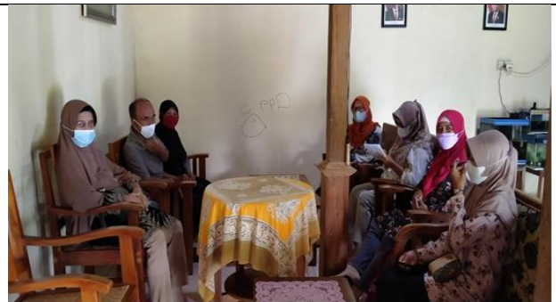
Gambar 2. Survey dan sharing dengan Kepala desa